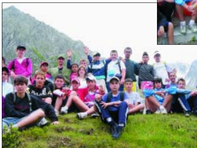
In alto, fino alla camminamento della 1ª Guerra Mondiale (Corno d'Aola) (mt. 2400).