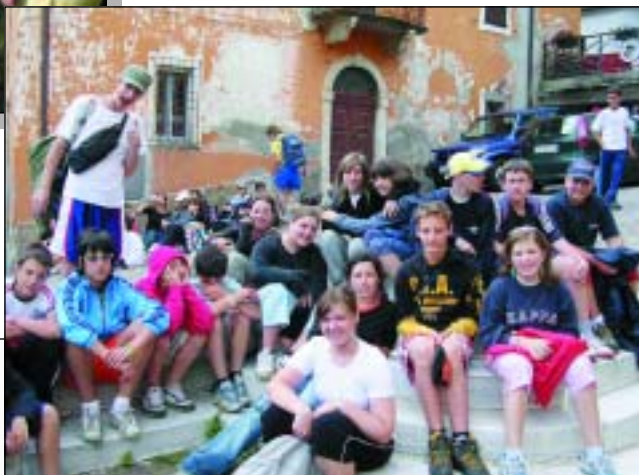
La prima salita a Cané in pellegrinaggio alla Chiesa.