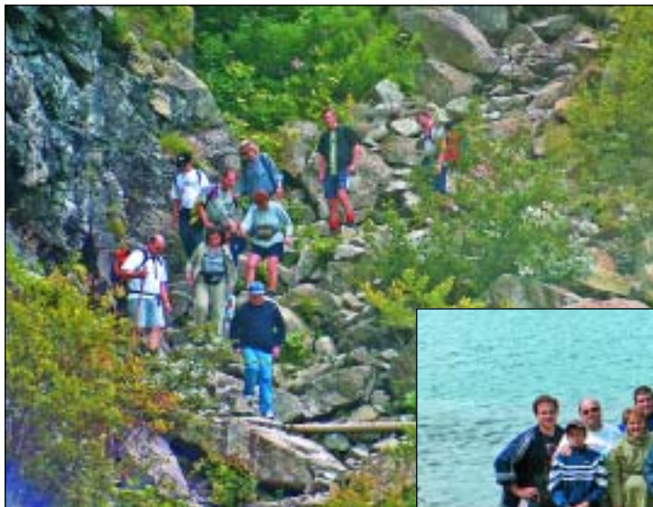
Discesa dal Lago Aviolo