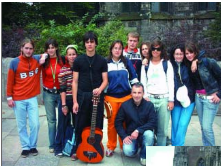
In Cammino con il Cammino.