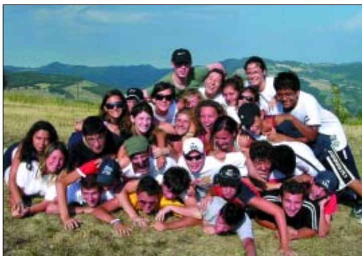
“Tutti in posa e... fermi!”