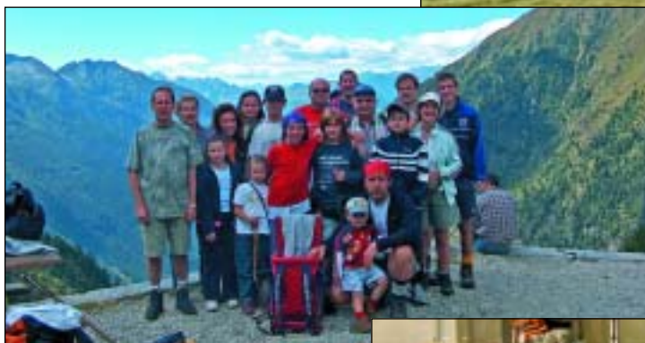
Al rifugio Lissone.