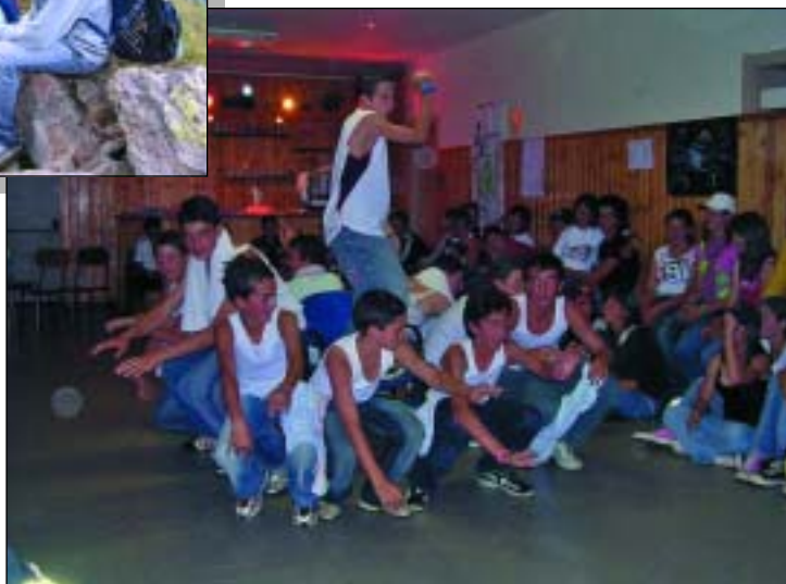
Un gruppo di ragazzi dà prova di sé durante la festa finale.