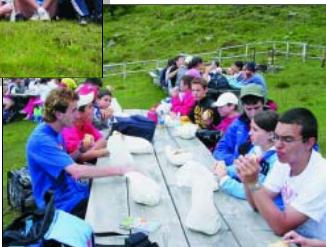
Finalmente il pranzo alla "Malga Prisigai" (mt. 2300) per la ricerca delle trincee.