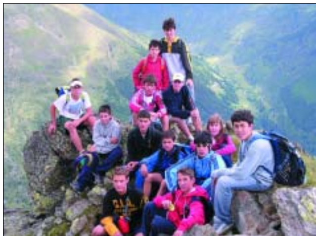
Un gruppo di esploratori è riuscito ad arrivare fino in cima alle Bocchette di Val Massa (mt. 2550)