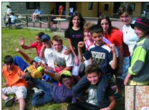
Durante il torneo di calcio nel parco di casa.