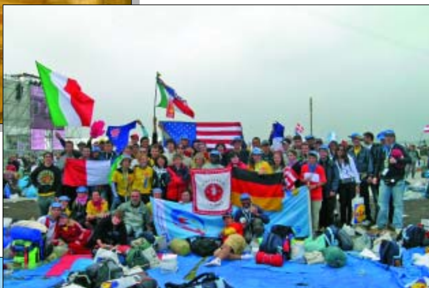
I verolesi... più... qualcun altro.