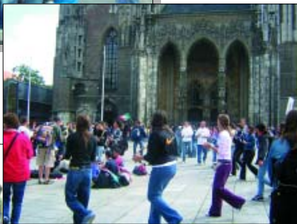
Allegria davanti alla Cattedrale di Colonia.